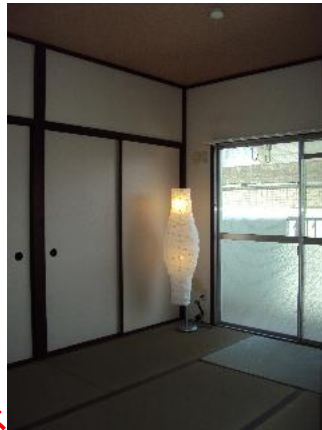
人気の和み空間「畳」スペース